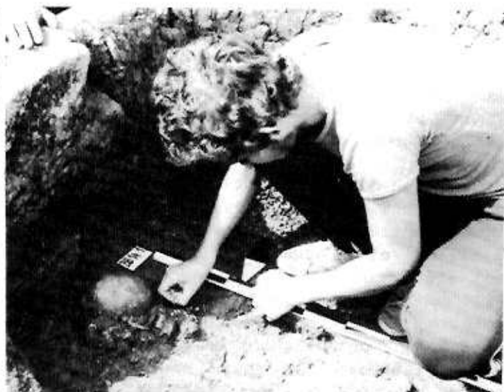
Prélèvement d'un collier (ép. méroving.)