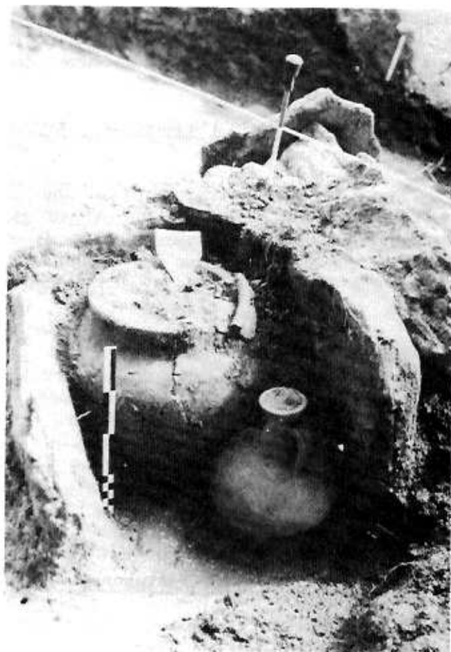
Urne funéraire et offrande, en caisson de pierre