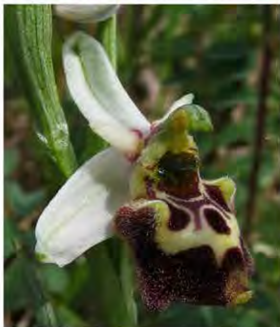
Sépales et pétales hypochromes

Ici, le bourdon se transforme en abeille et inversement. La nature adore les clins d'œil ! (M. B.)